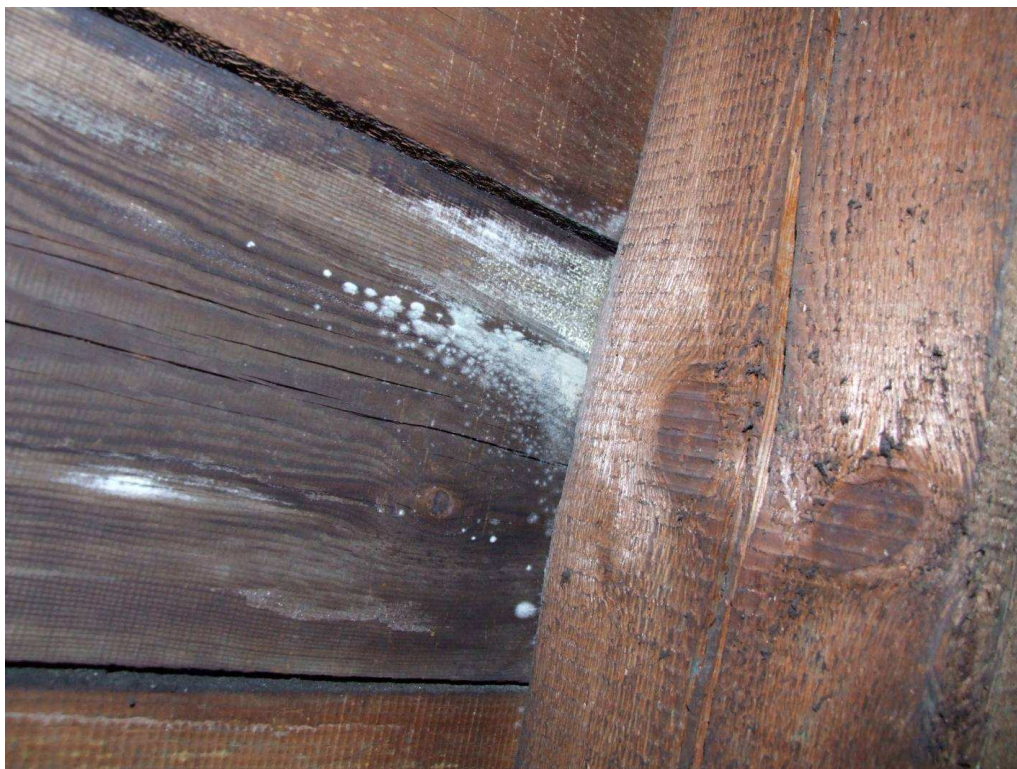
Fot. 10. Porażenie elementów deskowania przez powłoczniaka gładkiego.