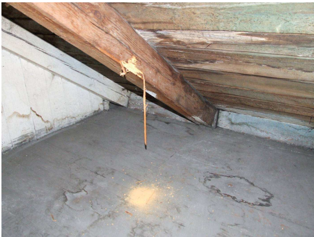
Fot. 2. Korozja krokwi na gł. 5mm wywołana żerowaniem larw spuszczela pospolitego