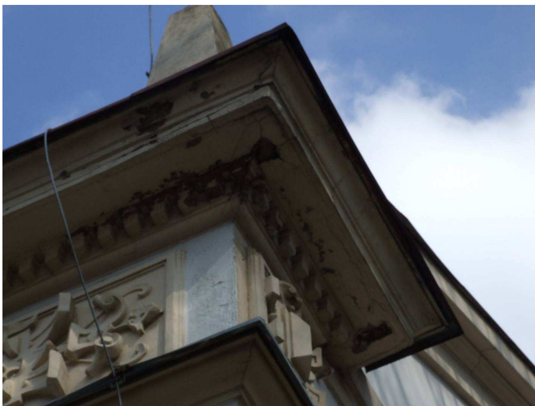
Fot. 18. Spękany i odpadający tynk gzymsu