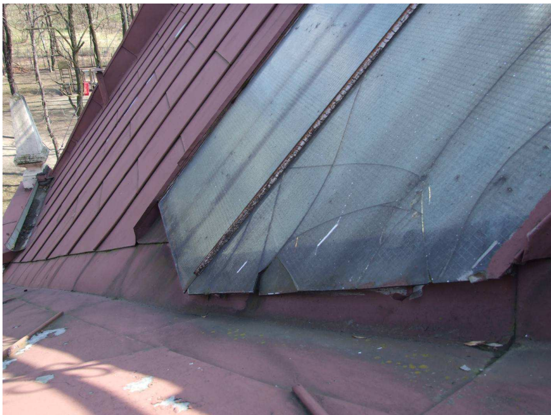
Fot. 21. Stan naświetla. Popękane szyby zbrojone.