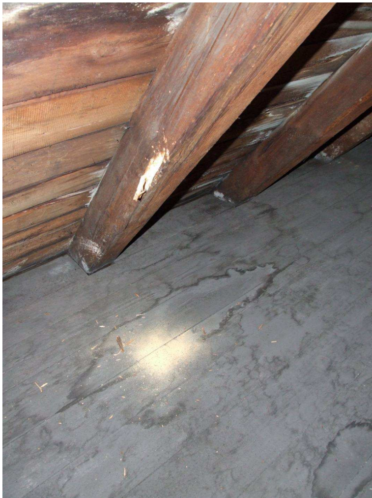
Fot. 9. Korozja krokwi na gł. do 10mm wywołana żerowaniem larw spuszczela pospolitego