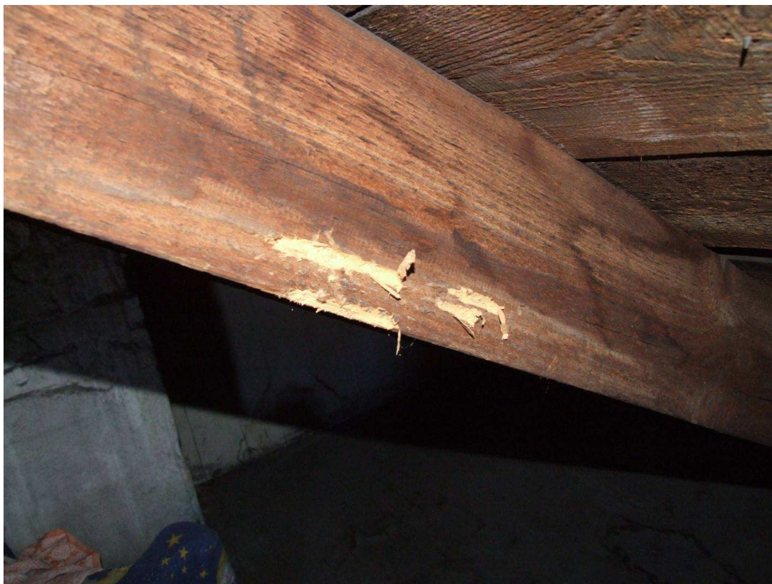
Fot. 1. Korozja krokwi na gł. 5mm wywołana żerowaniem larw spuszczela pospolitego