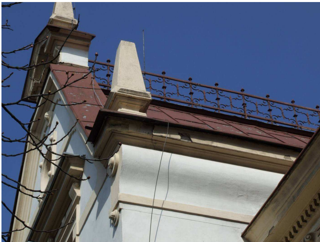
Fot. 17. Spękany i odpadający tynk gzymsu