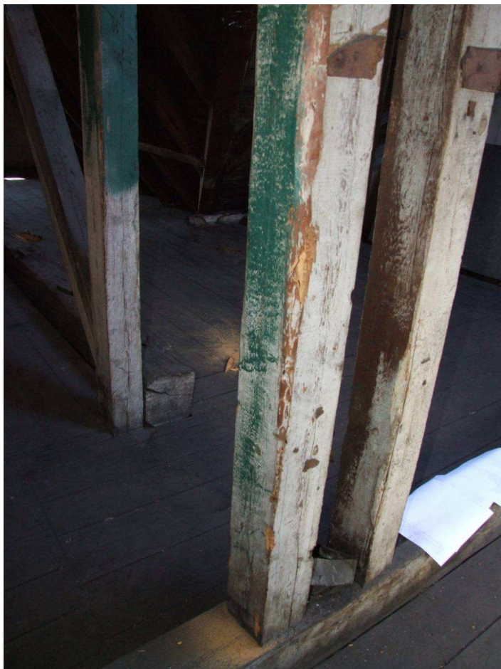
Fot. 15. Korozja stolców na gł. 5mm wywołana żerowaniem larw spuszczela pospolitego