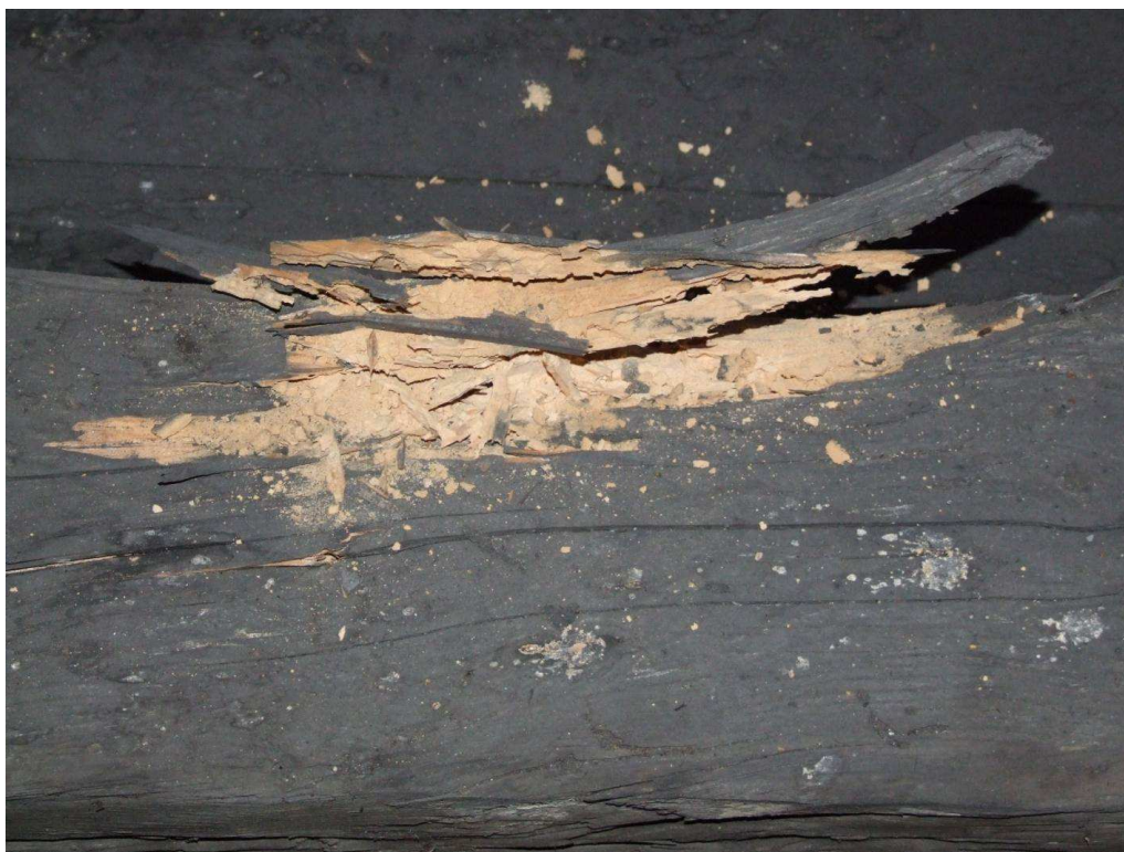
Fot. 16. Korozja nadciagu na gł. 35mm wywołana żerowaniem larw spuszczela pospolitego