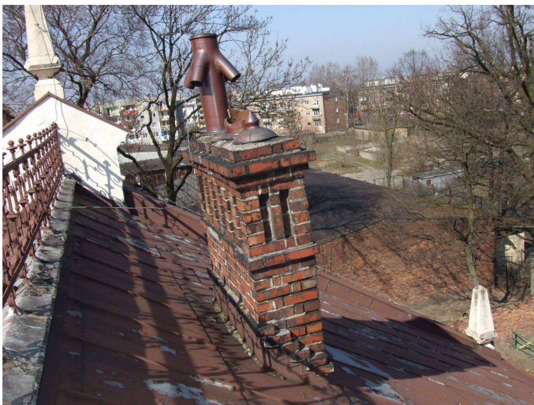
Fot. 20. Stan pokrycia dachowego