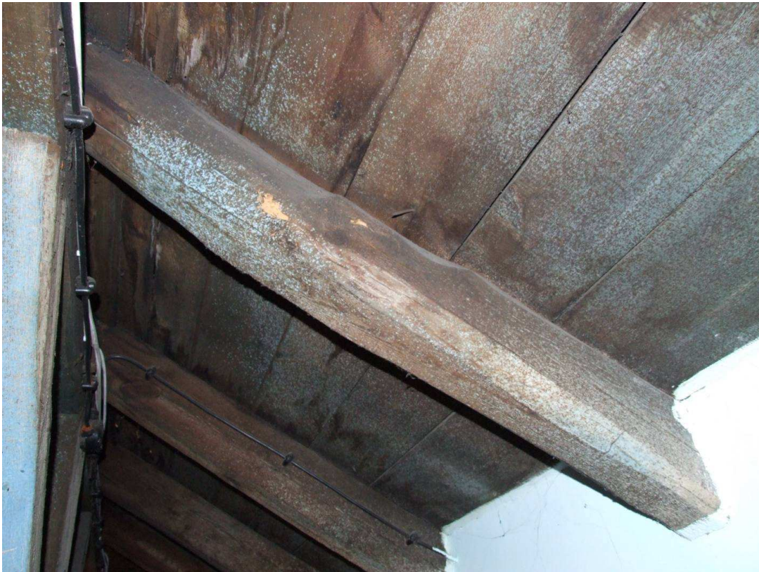
Fot. 3. Korozja krokwi na gł. 5mm wywołana żerowaniem larw spuszczela pospolitego