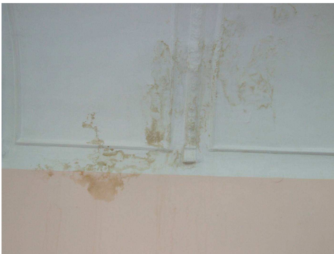
Fot. 24. Zacieki wywołane nieszczelnością pokrycia.