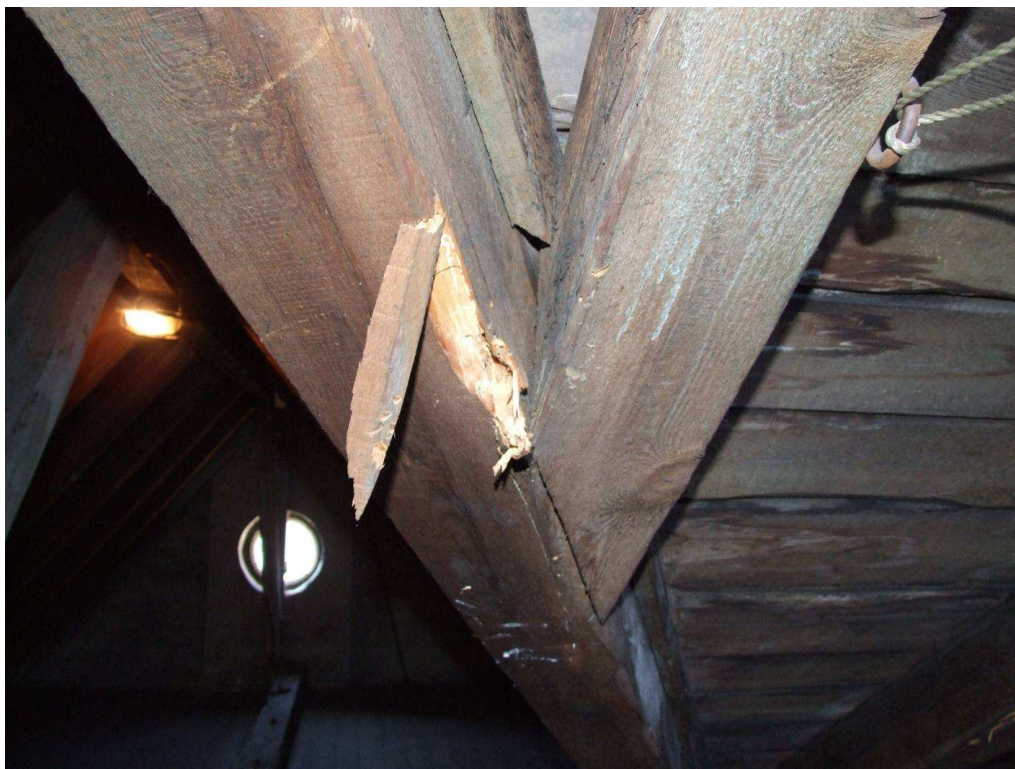
Fot. 7. Korozja krokwi koszowej na gł. do 10mm wywołana żerowaniem larw spuszczela pospolitego