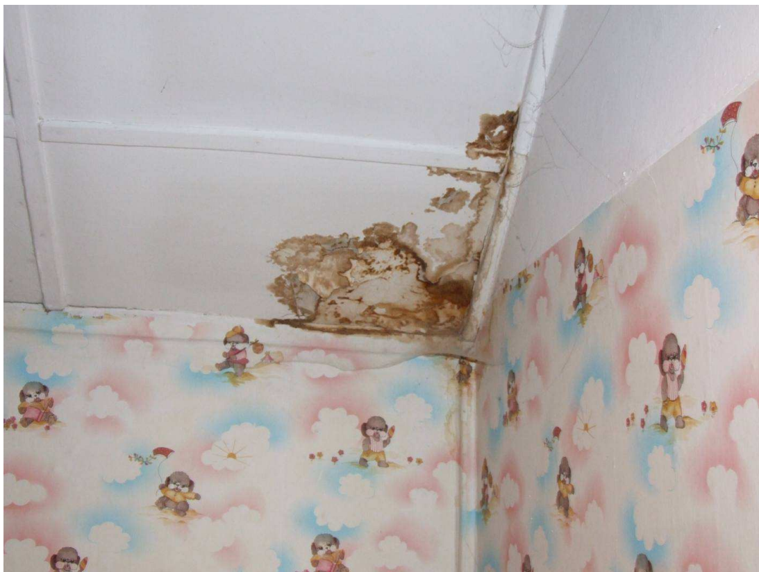
Fot. 23. Zacieki wywołane nieszczelnością pokrycia.