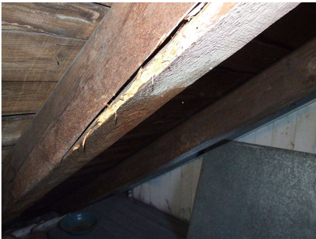
Fot. 6. Korożja krokwi na gł. do 10mm wywołana żerowaniem larw spuszczela pospolitego