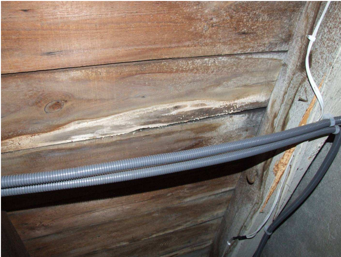
Fot. 11. Porażenie elementów deskowania przez powłocznika gładkiego.