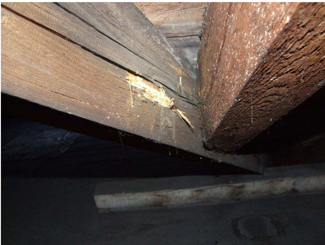
Fot. 12. Korożja krokwi koszowej na gł. 5mm wywołana żerowaniem larw spuszczela pospolitego