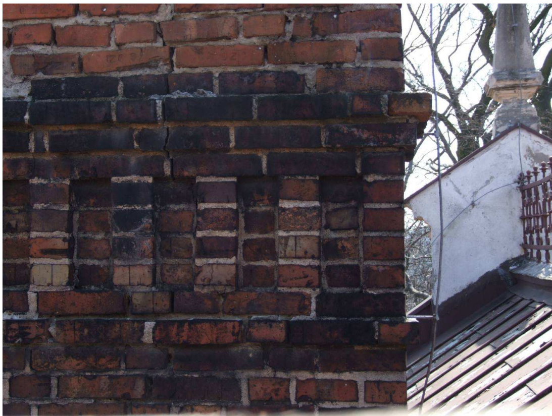
Fot. 19. Pęknięcie komina, ubytki zaprawy.