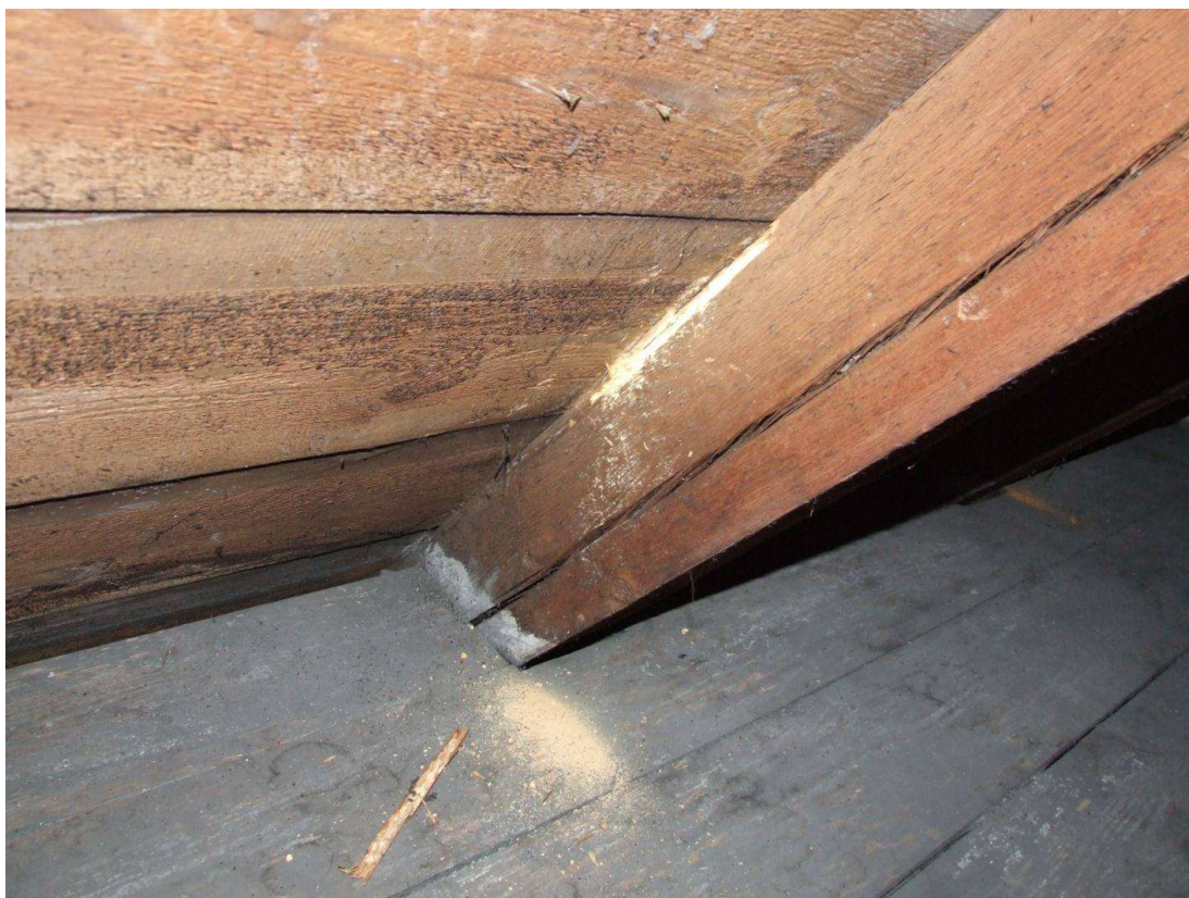
Fot. 14. Korozja krokwi na gł. 5mm wywołana żerowaniem larw spuszczela pospolitego