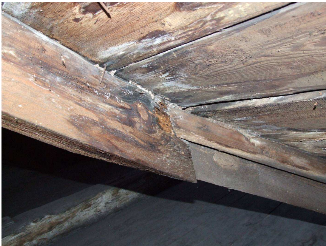
Fot. 5. Porażenie elementów przez powłocznika gładkiego. Brunatny rozkład drewna końcówki krokwi.