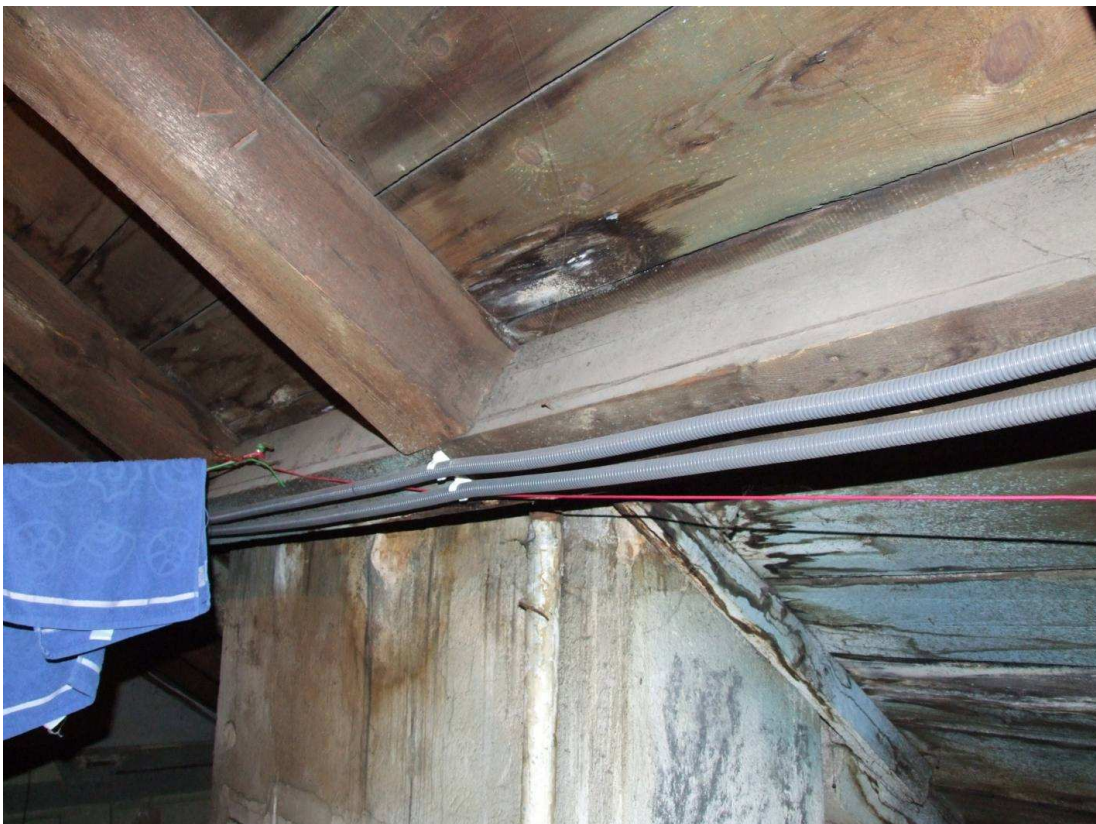
Fot. 4. Nieprawidłowe zakończenie odpowietrzenia instalacji kanalizacyjnej powodujące zawilgocenie deskowania