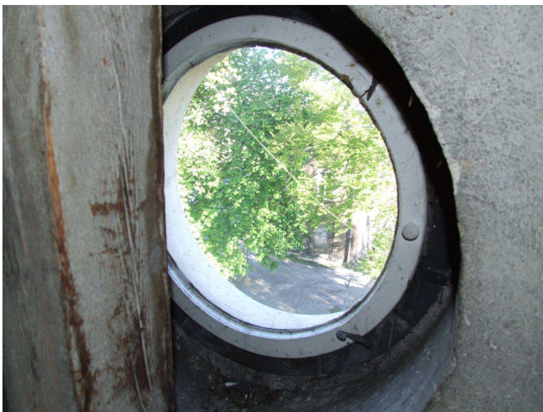
Fot. 22. Stan okien poddasza nieużytkowego. Uszkodzone oszklenie i rama okna.